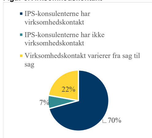
Figur 3. Virksomhedskontakt

IPS-konsulenterne har i de fleste jobcentre fået et kursus eller lignende for at klæde medarbejderne godt på. I de jobcentre, der endnu ikke er startet helt op med IPS, er man i gang med at uddanne medarbejderne til at kunne varetage en IPS-rolle. I samtlige jobcentre, der arbejder med IPS er konsulenterne dermed enten uddannet eller under uddannelse.