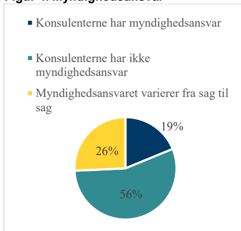
Figur 4. Myndighedsansvar