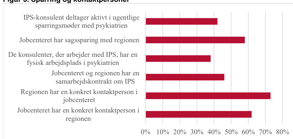
Figur 5. Sparring og kontaktpersoner

Jobcentre nævner regionerne som centrale samarbejdspartnere i IPS indsatsen. Regionen har i over 70 pct. af de jobcentre, der arbejder med IPS, en fast kontaktperson i jobcenteret, og jobcenteret har i over halvdelen af jobcentre en fast kontaktperson i regionen, ligesom cirka halvdelen af de jobcentre, der arbejder med IPS, har sagssparring med regionen/psykiatrien. Det giver et billede af, at når jobcenteret arbejder med i IPS-indsatsen, er der regelmæssig kontakt mellem jobcenter og psykiatri. Dette samarbejde mellem jobcenter og psykiatri er jf. IPS-metoden helt afgørende for at IPS-indsatsen lykkes. Af figur 5 fremgår fordelingen af respondenternes svar vedrørende deres kontakt med psykiatrien.